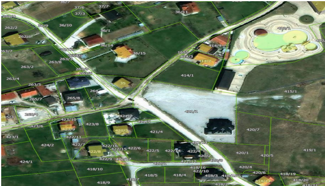
Slika 1. lukavički potok

propusta i cevi, izliva se: kroz naselje u pravcu Crkve gde redovno plavi veći broj porodičnih objekata i putem ka gradskom stadionu i dalje ulicom 7. Jula, pored zgrada, srednjih škola gde u tom pravcu sa leve strane plavi porodične stambene objekte i izliva se u dvorišta škola i dečijeg vrtića.